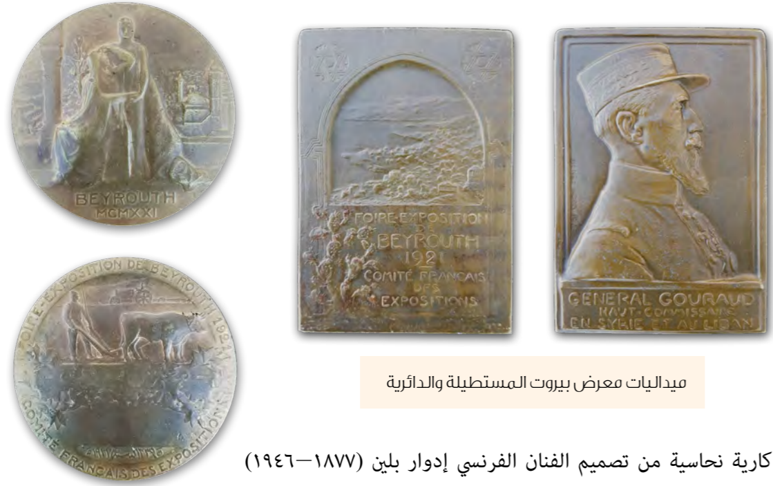
ميداليات معرض بيروت المستطيلة والدائرية

تذكارية نحاسية من تصميم الفنان الفرنسي إدوار بلين (١٨٧٧-١٩٤٦) يحفر عليها اسم الفائز.