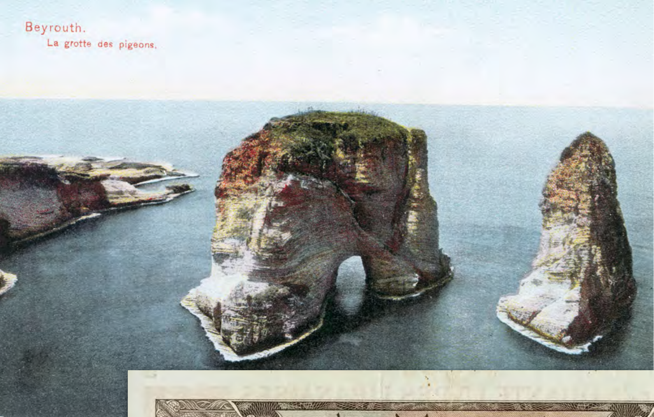
Beyrouth. La grotte des pigeons.