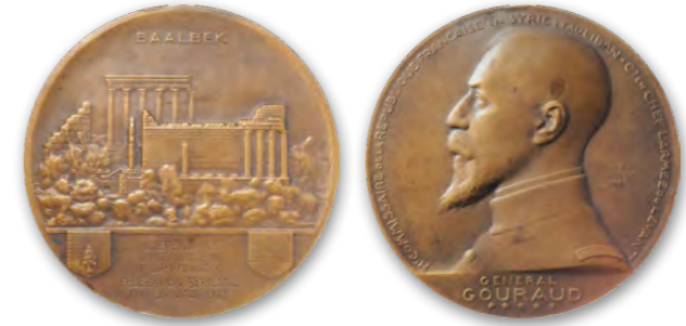
ميدالية «استقلال لبنان الكبير» وقيام «الإتحاد السوري»، سنة ١٩٢٣

وقد تكرّس هذا الواقع مع اتفاقية ١٩٢٤ إذ أشرنا في الفصل التمهيدي أنّها ألزمت بنك سوريا ولبنان الكبير بسحب أوراقه المالية في حال قرّرت الحكومات المحلية إصدار نقود معدنية كسرية. وبالفعل سمح المفوض السامي سنة ١٩٢٩ بسك قطع فضية من الفئات التالية: عشرة غروش، ٢٥ غرشاً و ٥٠ غرشاً. وقد وضعت هذه القطع في التداول اعتباراً من أيار ١٩٣٠ ٢ . وسرعان ما جرى تزويرها لا سيما فئة الخمسين غرشاً إذ انتشرت قطع مزيفة مصنوعة من الرصاص في بيروت وزحلة ووصل الأمر إلى حلب.