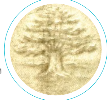
العلامة المائية: أرزة

وضعت في التداول بتاريخ ١ كانون الثاني ١٩٥٣.